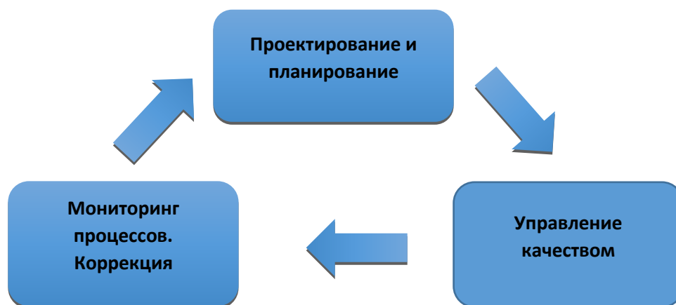
Схема 1. Треугольник управления качеством (модель управления качеством)

Система управления качеством образования представляет собой непрерывный замкнутый процесс, состоящий из взаимосвязанных и взаимообусловленных элементов (схема 1).